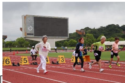
第41回広島県マスターズ陸上選手権大会にて(左端)